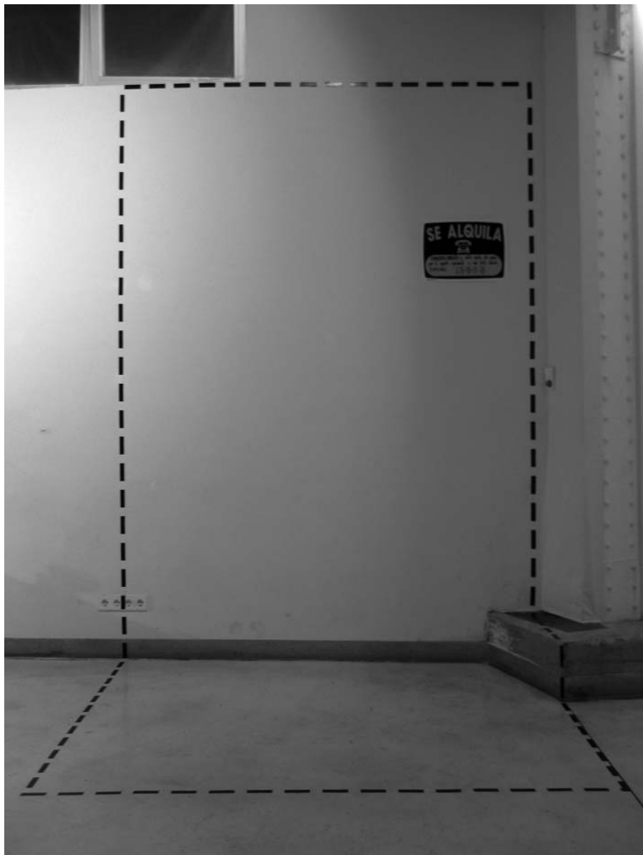
Presupuesto 6 €: Prácticas artísticas y precariedad, Off-Limits, Madrid, 2010